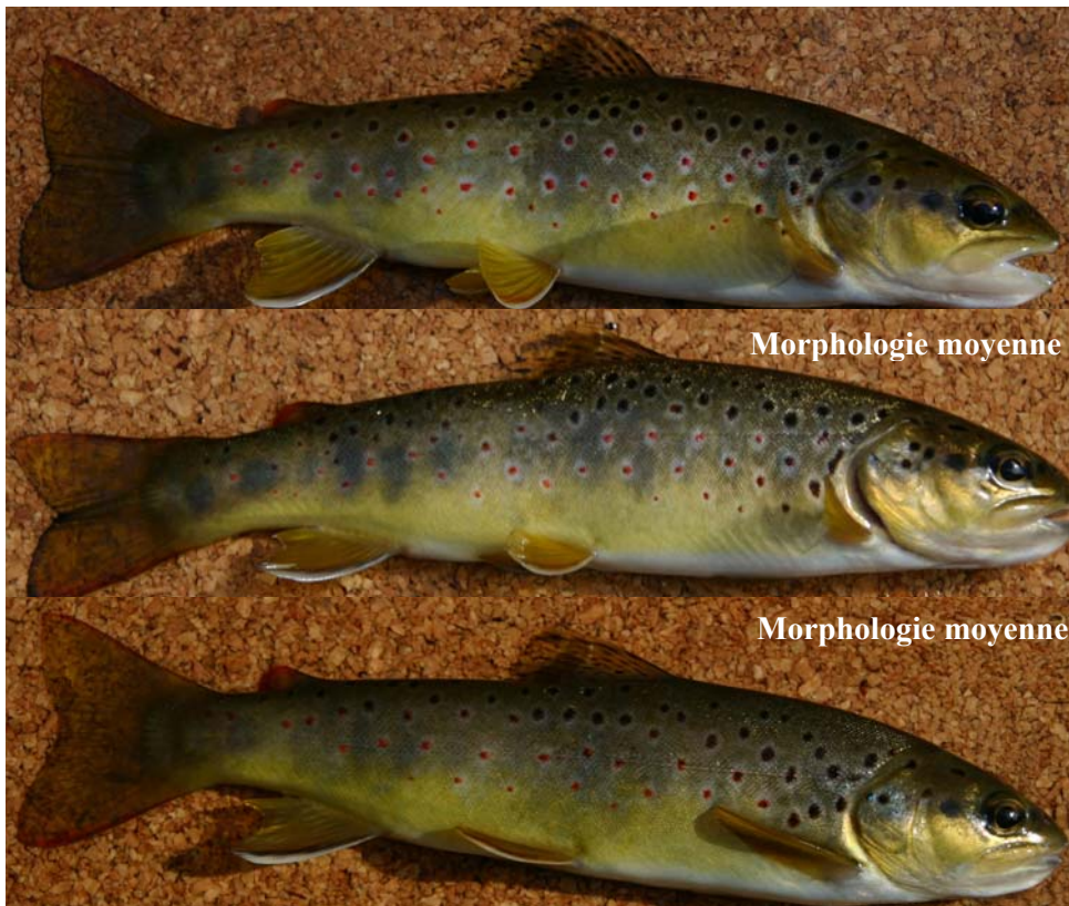
Illustration du morphotype de la population

pr-a : nb. de points rouges sur la zone A pn-a : nb. de points noirs sur la zone A